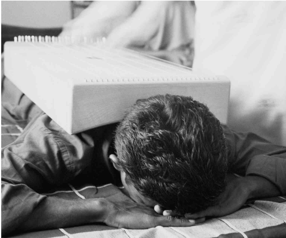
Abb. 4 Indischer Patient wird bespielt