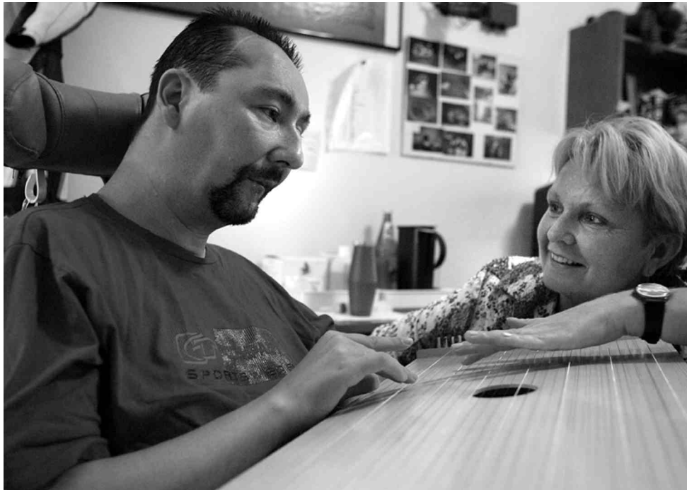
Abb. 3 Wachkomapatient spielt aktiv auf Tambura

Inzwischen (März 2005) gibt es ca. 50 Körpertamburas, die vorwiegend von Musiktherapeutinnen, in zunehmendem Maße aber auch – und zwar deutlich mehr als andere Instrumente – von Behandlerinnen aus anderen Gesundheitsbereichen eingesetzt werden (Ärztliche und Psychologische Psychotherapeuten, Logopäden, Ergotherapeuten, Physiotherapeuten, Atemlehrer, Yogalehrer, Sterbebegleiter).