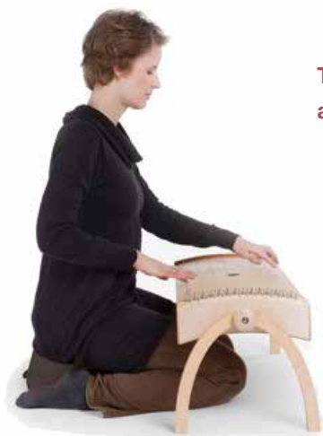
Tambura corporelle aux pieds arqués

Cette tambura corporelle est un instrument à position stable et de hauteur agréable pour jouer. Les cordes sont situées sur le dessus. Mais on peut aussi retourner la caisse sur son axe et l'utiliser ainsi en tant que berceau musical fixe pour un nourrisson.